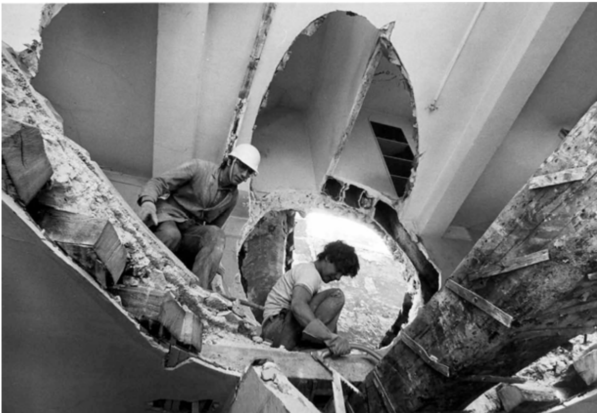
Gordon Matta-Clark, Conical Intersect (1975). Edificio adyacente al Centro Pompidou.