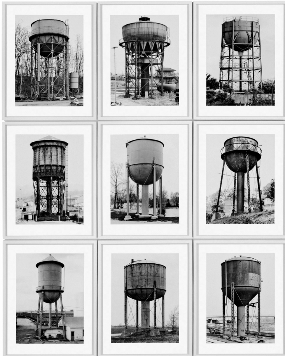
Bernd y Hilla Becher.

infraestructuras para la creación y la producción artística, debería concentrarse en la creación de contextos que sepan generar posibilidades y no como meras estrategias multiplicadoras de contenedores.