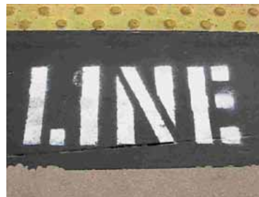
Vega, Elo; Bongore, José Luis. Paso Hormiga . 2010. 24 s en loop. Frontera de Tijuana con USA.