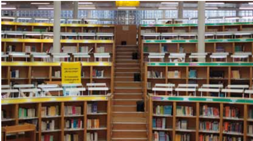
Bongore, José Luis. Hola, soy europeo. ¿Me das trabajo? Cartel . 2012. Imagen RAW de 5616 x 3744 píxeles. Biblioteca de la Universidad Carlos III. Getafe, España.