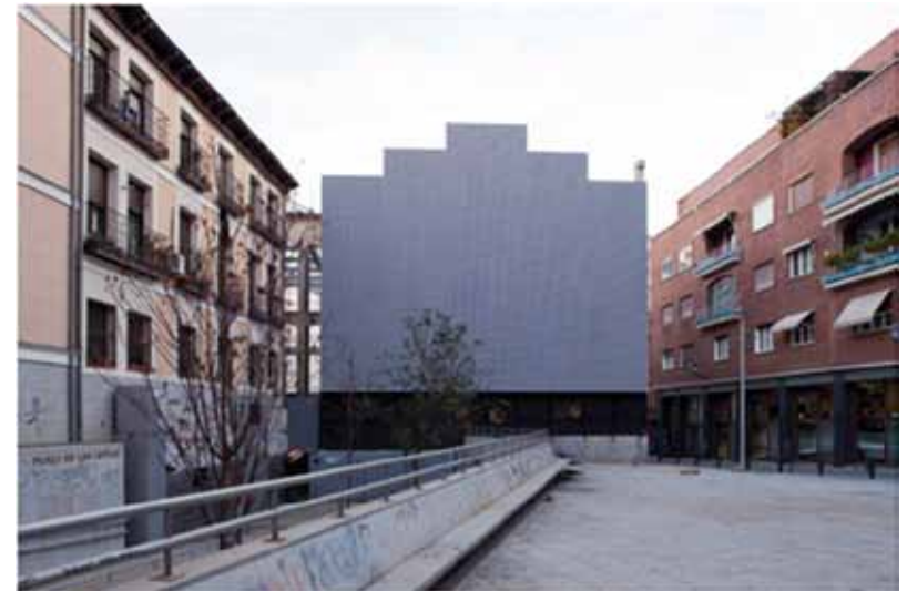
Sede de Medialab-Prado. Antigua Serrería Belga. Madrid.