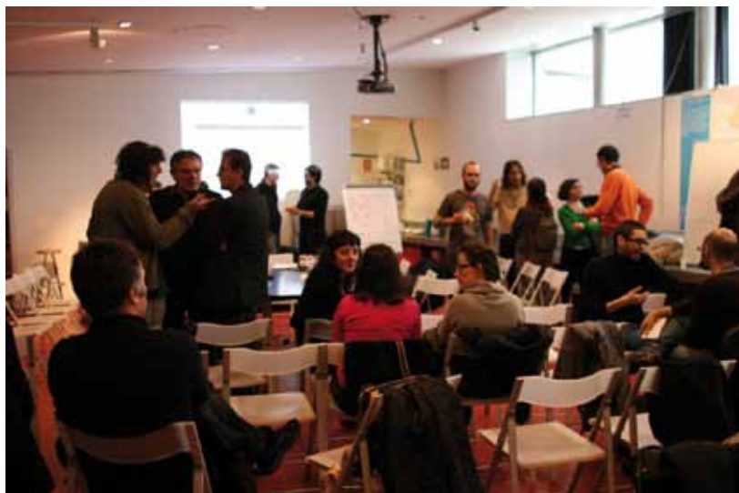
Última sesión de Pensando y Haciendo. Presentación de las conclusiones del proceso de recogida de puntos de vista y análisis de textos críticos sobre Medialab-Prado. 03/03/2011.