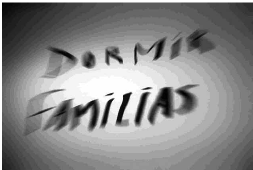
Peñañiel, Javier. Mosquito de ensayo . 2004. Film 16 mm transferido a DVD. 3 min 48 s en loop. España.