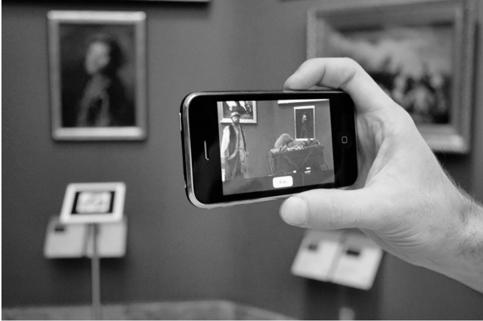
Imagen 4. Superposición gracias a la Realidad Virtual de una recreación teatral en una de las obras de arte.

Relatos visuales, descargables mediante unos QR code dispuestos cerca de las obras, que los usuarios podían visualizar gracias a la cámara del dispositivo móvil y a la aplicación de RA ( vid. Imagen 4).