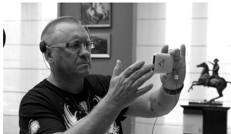
Imagen 3. Visitante utilizando la aplicación móvil.

Entre las diferentes acciones promocionales diseñadas por la mencionada agencia publicitaria, la más espectacular fue Stories Behind the Paintings (Historias detrás de las pinturas) , una aplicación móvil que se sirve de la RA (vid. Imagen 3). En un ejercicio de storytelling , se utilizaron determinados hilos conductores universales como el amor, la guerra o el poder, mediante los que se recrearon, con ayuda de actores y escenografías muy elementales, un conjunto de historias alrededor de ocho de las obras maestras de la galería 14 .