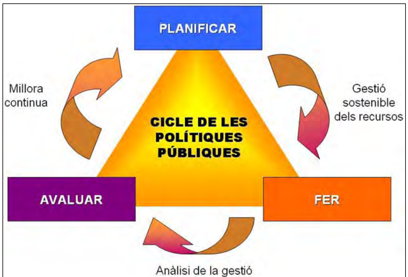
Figura 1. Cicle de les polítiques públiques (elaboració pròpia adaptant la formulació de Harold D. Lasswell)

El politòleg Harold D. Lasswell, pioner de la ciència política, va establir ja en els anys seixanta les etapes que havia de tenir el cicle de tota política pública (Lasswell, 1964, 1996). La seva teoria, plenament vigent, estableix que qualsevol política ha de partir de la planificació i que un cop implementades les accions que se'n deriven, cal avaluar-ne els resultats com a punt de partida per millorar amb l'inici d'un nou cicle.